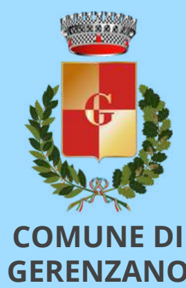
COMUNE DI GERENZANO