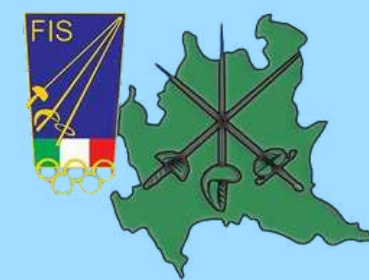
COMITATO REGIONALE LOMBARDIA